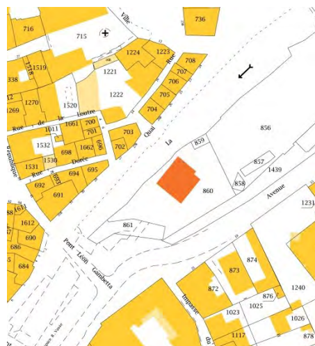
Parcelle dans le cadastre actuel ©2017 Ministère de l'Action et des comptes publics