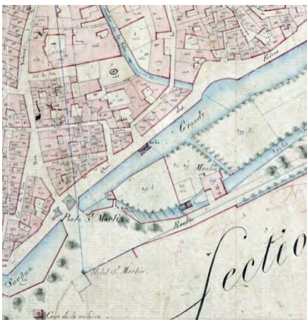
Cadastral napoléonien, 1828 AD Vacluse

Protection : Édifice d'intérêt patrimonial exceptionnel (AVAP)