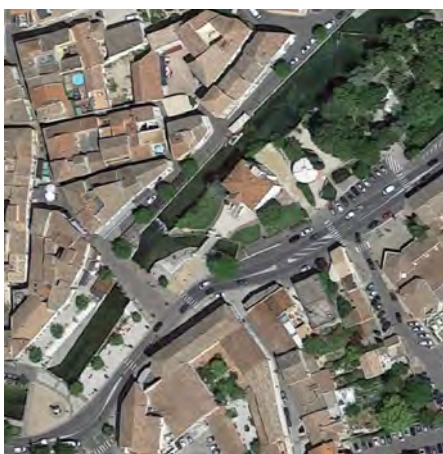
Vue aérienne de l'îlot

Rédacteur : Cécile Bréchet (Direction du Patrimoine 2018)