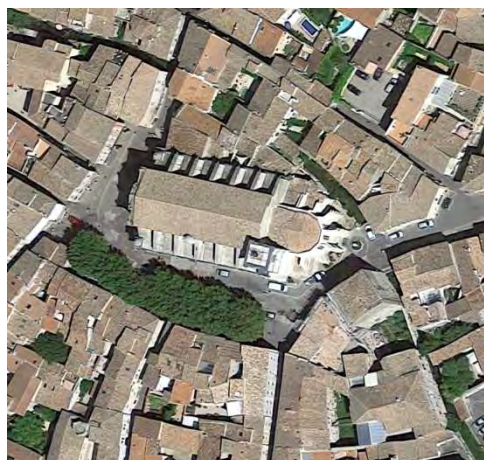
Vue aérienne de l'îlot

Rédacteur : Cécile Bréchet (Direction du Patrimoine 2018)