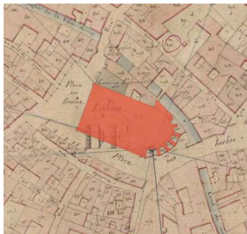
Cadastré napoléonien, 1828 AD Vaucluse

Protection : Classée monument historique